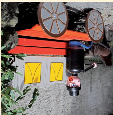
Zátní procházka u kostela sv. Kříže ve Frauenstraße.